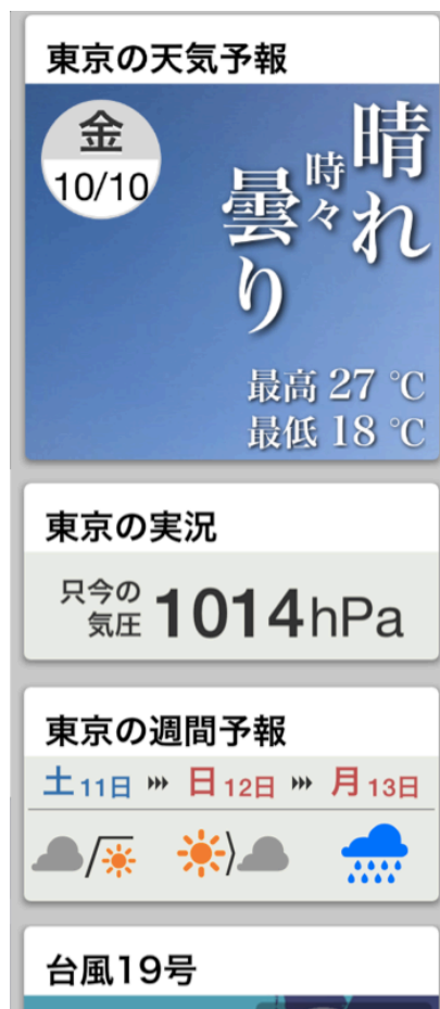
※図3 『らくらくウェザーニュース』

“台風情報” “天気予報” “実況天気” “10分天気” “週間予報” “ライブカメラ” “雨雲レーダー” “衛星雲画像” “天気図” “地震情報” “津波情報” “ゴルフ情報” “マリン天気” “波・風マップ”