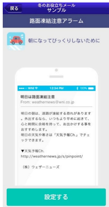
図 3：“路面凍結注意”のメール画面 (サンプル)