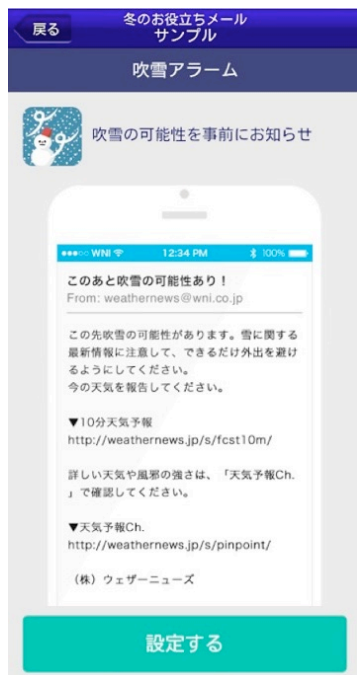
図 2：“吹雪アラーム”のメール画面 (サンプル)

お知らせする“暖房節約”、屋外で飼っているペットを屋内に入れた方が良い寒さの時に知らせする“ペットも寒いよメール”など、様々な冬のライフスタイルに対応するラインナップです。ご自身のライフスタイルに合ったサービスを活用して、安全で快適な冬をお過ごし下さい。