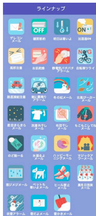
図 4：『冬に役立つメールサービスコレクション』の一覧画面