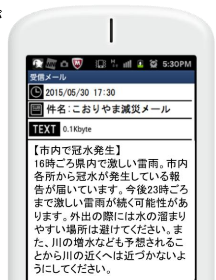
※“こおりやま減災メール”イメージ