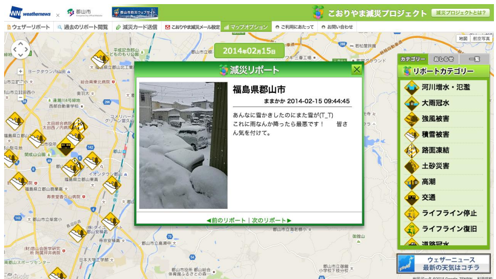
※“こおりやま減災プロジェクト”インターネットサイトのイメージ図

“こおりやま減災プロジェクト”では、大雨や雪などあらゆる気象災害による被害状況の報告を募集しています。