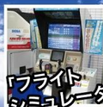
「フライト シミュレーター」