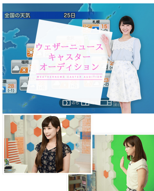
24時間生放送お天気番組「SOLiVE24」

ウェザーニューズは、航海・航空・鉄道・コンビニなど各種企業や、TV・インターネットなどを通じて一般向けにサービスを展開する世界最大の気象情報会社です。今回募集する「ウェザーニュースキャスター」は、24時間生放送のお天気番組「SOLiVE24」を担当していただきます。番組は、「ニコニコ生放送」「LINE LIVE」「AbemaTV FRESH!」「YouTube Live」など各種動画サイトにも配信されています。日々、視聴者にチャットやビデオチャットを通じて今の天気や服装を聞くなど、双方向型の新しい天気番組の制作にチャレンジしていくこととなります。番組出演のほかにも、東京駅・品川駅など駅構内のデジタルサイネージ、スタジオを飛び出して全国各地のサポーターに会いに行く中継やイベントなど、様々なメディアを通して幅広く活躍いただきます。