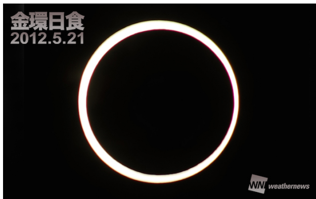
2012 年 5 月 21 日金環日食のレポート

次回の金環日食は、チリ・アルゼンチン・アンゴラ・コンゴで見られる 2017 年 2 月 26 日で、日本で金環日食が見られるのは 14 年後の 2030 年 6 月 1 日(北海道のみ)です。本特別番組を通して、この非常に珍しい金環日食の感動の瞬間を、視聴者の皆さんと一緒に共有していきたいと思えます。