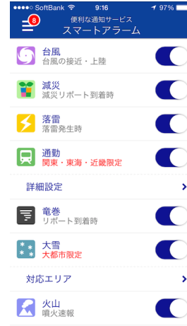
スマートアラーム設定画面

スマホアプリ「ウェザーニュースタッチ」の通知サービス「スマートアラーム」にて台風 13 号情報の配信を開始しました。「スマートアラーム」の“台風”の設定をオンにしておくと、GPS 機能を利用し、出張先や旅行先でも自分の現在地に合わせて、台風の接近・上陸に関する情報や、雨・風の強さ、交通機関への影響など、どこよりも詳しいピンポイントの台風情報を受け取ることができます。この夏は全国で台風の上陸が相次ぎました。秋の台風も、日本に上陸しやすいコースをとり、過去に大きな被害をおよぼしたものが多くのが特徴です。台風シーズンは 10 月まで続きますので、ぜひ今のうちにご登録ください。