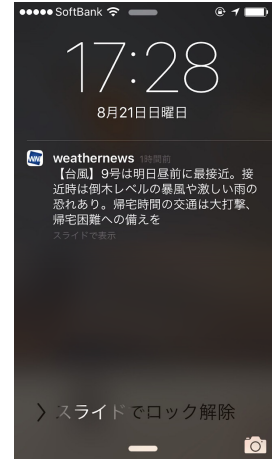
スマートアラームサンプル