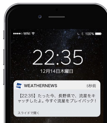
『流星キャッチャー』サンプル

『流星キャッチャー』は、中継で捉えた流星の動画が3分以内にスマホにプッシュ通知で届くサービスで、スマホアプリ「ウェザーニューズタッチ」の「星空 Ch.」から登録できます。“ふたご座流星群”の流星が多く期待できる(14日21時～24時)は、ウェザーニューズのスタッフが国内3か所の流星中継をモニタリングし、流星が確認されると同時に動画を編集して、登録している方のスマホにプッシュ通知でお届けします。プッシュ通知から開いた画面では、流星の動画をすぐにご覧いただけます。『流星キャッチャー』の対象エリアは、“全国”または“このエリア周辺のみ”から選択できます。