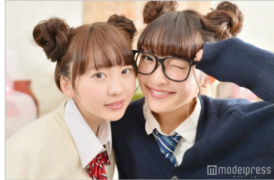
LINE LIVE 限定番組ゲスト“まこみな”