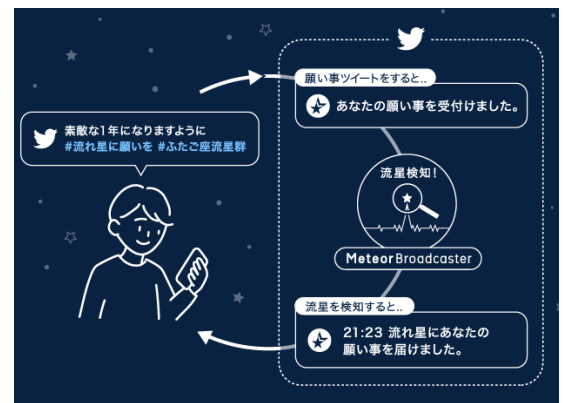
『MeteorBroadcaster』参加型企画 イメージ画像

また、ウェザーニューズが参画する、リアルタイム流星観測プロジェクト『MeteorBroadcaster(メテオブロードキャスター)』の参加型企画として、流れ星への願い事を twitter で募集します。参加方法は簡単で、2つのハッシュタグ「#流れ星に願いを」「#ふたご座流星群」をつけて願い事をツイートするだけです。中継中に流れ星を捉えたら、ユーザーからお預かりした大切な願い事を流れ星に届け、満天の星空の中継画面に映し出します。