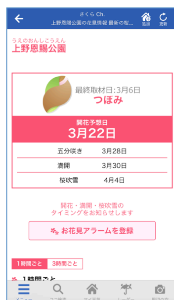
『お花見アラーム』をタップした後は名所の詳細情報へ(サンプル)