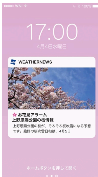
『お花見アラーム』サンプル

なお、『お花見アラーム』に登録した名所は、「さくら Ch.」内のトップページに表示され、詳細情報のページへ簡単にアクセスできるようになります。