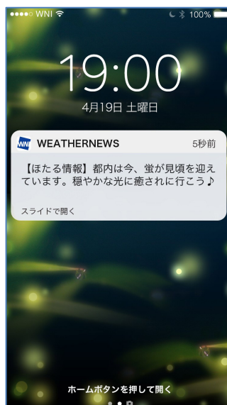
『ほたるのヒカリ』通知サンプル

ほたるの見頃はたった 2 週間しかない上に、出現タイミングは気象条件にも左右されます。このため、全国のユーザーから寄せられる報告を元に各地の出現状況を把握し、出現しやすい気象条件(蒸し暑い、曇っている、風が弱い、月明かりがない)を加味して、都道府県ごとに観賞に最適なタイミングをお知らせします。はかなくも美しい瞬間を逃さないよう、本サービスを事前に登録しておくことをおすすめします。