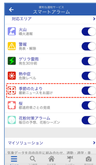
「スマートアラーム」の「季節のたより」を ON