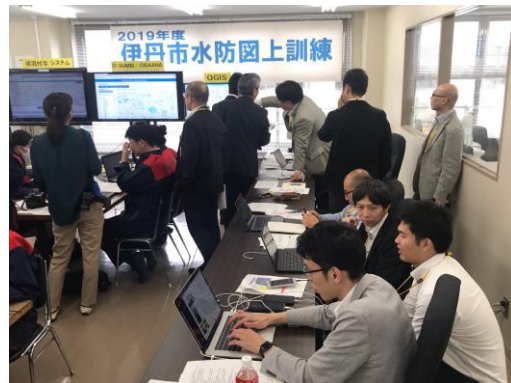
写真手前3名はウェザーニュースのスタッフ