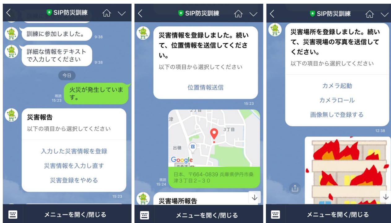
訓練当日の災害情報登録画面

訓練では、まず平成30年台風第21号が接近した際に実際にTwitter上で発信された被災状況を知らせるツイートをもとに市職員が災害現場調査を実施し、その被害状況を「防災チャットボット」を利用して報告しました。