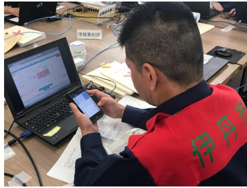
(左)伊丹市職員が「防災チャットボット」でメッセージを送信の様子 (右)訓練当日の安否確認画面

また、31日15時に伊丹市の職員が「防災チャットボット」を用いて安否確認メッセージを一斉送信し、訓練本部には参加した105名から返信メッセージが届きました。「防災チャットボット」は、メッセージに自動応答するとともに、安否情報を自動で抽出し、避難行動支援リストと照合しました。照合結果はリアルタイムに集計され、伊丹市の職員は一覧を見ることで市民の安否状況を瞬時に把握することができました。