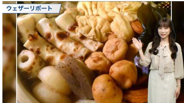
視聴者からの「おでんレポート」も紹介