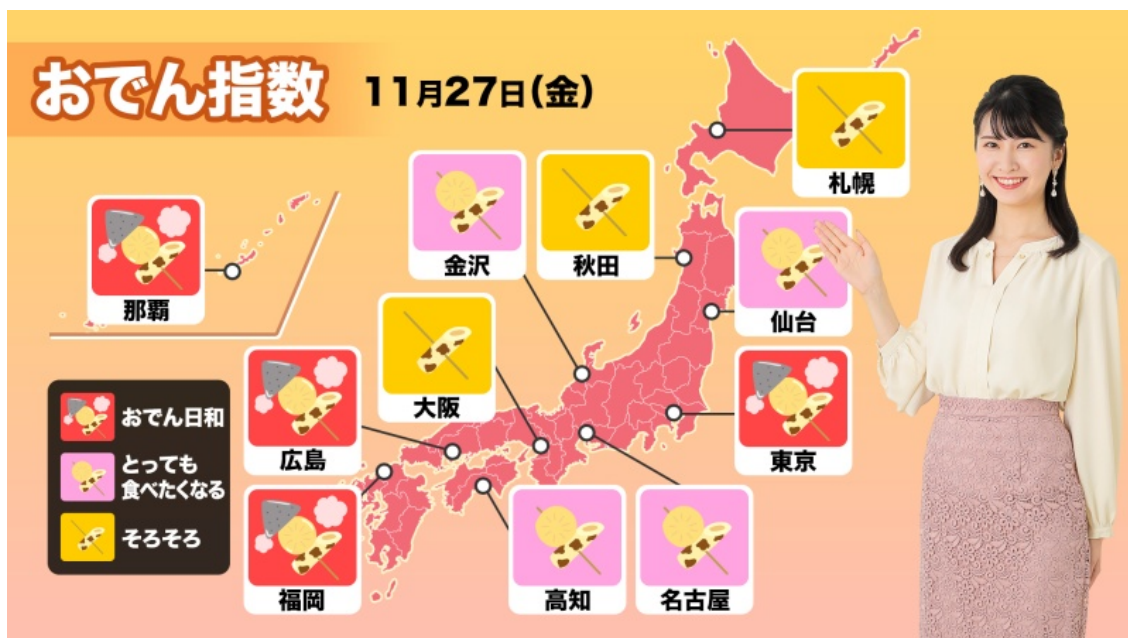
「おでん指数」サンプル

視聴はこちらから: https://www.youtube.com/user/weathernews