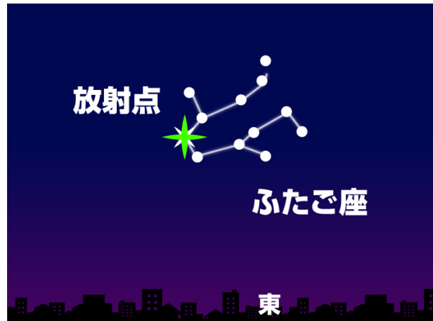
13日・14日の21時頃 東(東京)

放射点のあるふたご座は、東京では18時頃から空に昇りはじめます。放射点が空高くに昇るにつれて流星の数も増えてきます。流星は空のあちらこちらに飛ぶので、空を広く見渡して観測するのがおすすめです。しっかりと寒さ対策をして流星観測をお楽しみください。