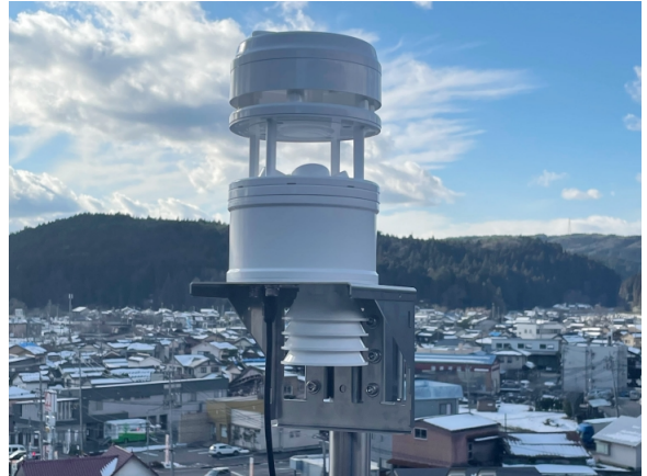
石川県の病院に設置された気象観測機

民間企業においては、災害救助用のヘリコプターの安全運航、ロードサービスの事業者による走行不能車両の移動、通信会社による避難所に対する通信機器の配備、食品メーカーによる避難所へ緊急食糧や緊急物資の配送、物流会社による物資の配送や従業員への車両燃料の配布など、様々な用途で用いられました。