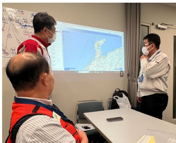
石川県庁対策本部での気象情報提供

※経済産業省: 令和6年能登半島地震の復旧対応等に貢献した企業・団体等に対して感謝状を授与しました