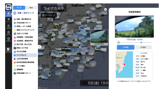
ライブカメラ(サンプル画面)

ウェザーニュースのユーザーから 1 日 20 万通(写真・動画付きリポートは 2 万通)届くウェザーリポートも見ることができます。リポートはマップ上に表示して確認できるほか、カテゴリで絞り込んだり、過去に遡ったりして確認することも可能です。さらに全国に展開するライブカメラ 1,600 台の映像も閲覧できます。気象観測機では捉えることのできない、実際の空や雲の様子や天気の状態を写真や動画でチェックすることができます。