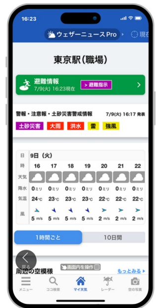
スマホアプリ専用画面(サンプル画面)

さらに、30 時間先までの雨雲レーダーやカスタマイズ可能なプッシュ通知機能など、有料会員向けのものも含めたアプリの全機能を、広告なしでご利用可能です。台風・大雨・ゲリラ雷雨・熱中症・地震などの最新の情報をスマホでいつでもどこでも確認することができます。また、医師と共同開発した天気痛予報、洗濯物の乾く時間がわかるお洗濯情報など、生活に役立つコンテンツも満載です。