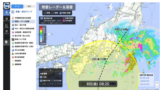
雨雲レーダー&落雷(サンプル画面)

本サービスでは、お天気アプリ「ウェザーニュース」で一番人気の超高解像度雨雲レーダーが PC の大きな画面で確認できます。250m 四方/10 分間隔という超高解像度で、30 時間先まで雨雲の動きをくつきり滑らかに表示するため、雨がいつ降っていつ止むのか、強まるタイミングまで詳細にチェックできます。また、落雷リスクや台風進路予測、線状降水帯解析などを重ねて表示し、あらゆる気象リスクを地図上で一元的に把握することができます。さ