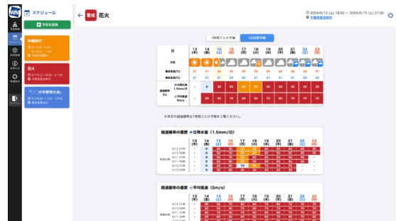
スケジュール機能(サンプル画面)

さらに、「スケジュール機能」では、出張や旅行、学校行事などのイベントのスケジュールに合わせて、大雨や強風のしきい値を設定すると、その日の大雨や強風の確率を確認することができます。例えば旅行の期間に荒天となるリスクや、運動会など学校行事が中止になるリスクをチェックすることが可能になります。