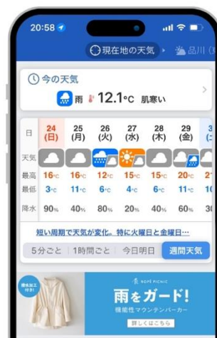
雨の予報と連動する マウンテンパーカーの広告

2024年春、株式会社ジュンが運営する「ROPE PICNIC(ロペピクニック)」は、雨や花粉に強いアウターを効果的にプロモーションするために広告サービスを活用。何種類もクリエイティブを用意しておき、前日や当日の雨量や気温、花粉の飛散量に合わせて広告を表示しました。また、YouTube や TikTok で気温別や着回しコーデなどの動画を配信。同時にお天気キャスターの Instagram や X でもショート動画を投稿し、「ウェザーニュース LIVE」でこれらの取り組みを紹介することで、プロモーションの効果を引き上げました。これらの相乗効果もあり、想定を大幅に上回るクリック率で早々に完売となったといえます。