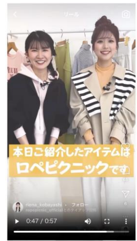
Instagram における コラボ企画の動画配信