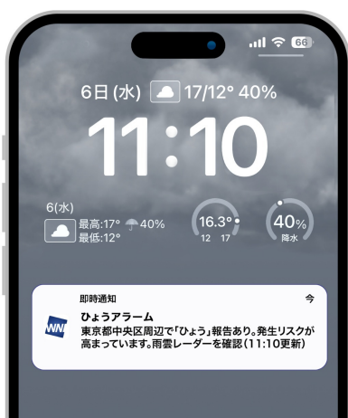
「ひょうアラーム」サンプル画面

より専門的な情報を拡充した「ウェザーニュース Pro」の PC サイトでは、36 時間先まで 1 時間ごとの降雹リスクを「注意」と「警戒」の 2 ランクでご確認いただけます。今後のリスクを把握したい場合に便利です。