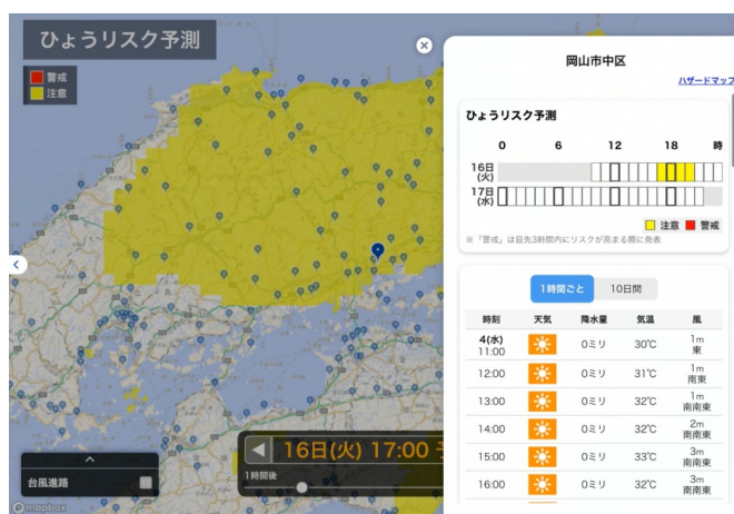
「ひょうリスク予測」サンプル画面