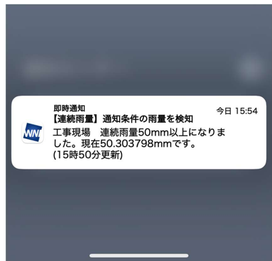
連続雨量の通知画面 50mmのなど設定値を超えると即時通知する