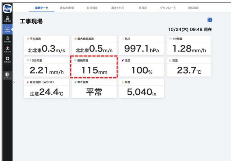
パソコン版の観測データ画面、1分毎の観測値を大きく表示

「ソラテナ Pro」は設置場所の降雨を1分毎に積算し、アプリやパソコンの専用ウェブサイトリアルタイムに表示します。いまの連続雨量を確認できるほか、これまでの雨量の上昇をグラフで確認することができます。また、日付を指定して連続雨量を振り返ることや、過去データをcsvでダウンロードして当時の連続雨量と被害状況を分析することも可能です。