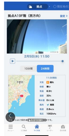
アプリではカメラ映像がリスト化され 出先でも閲覧できる