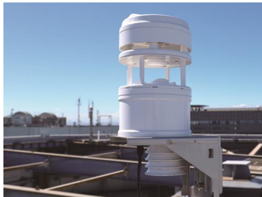
高性能気象 IoT センサー「ソラテナ Pro」