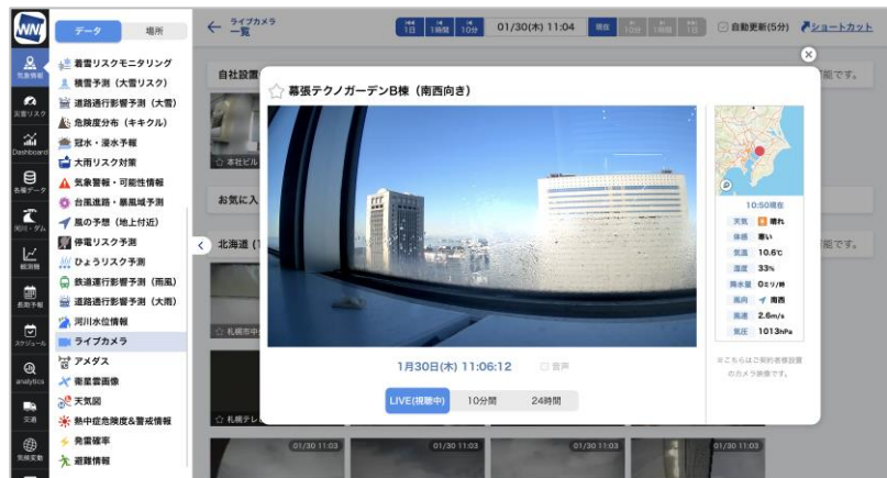
法人向け「ソラカメ」はストリーミング再生に対応

また、「ウェザーニュース for business」と「ソラテナ Pro」は気象リスクが高まった際に、事前に設定した条件に基づいてスマホのプッシュ通