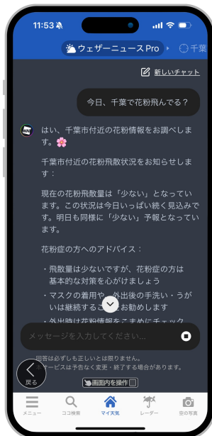
図 1: 任意の地点の花粉飛散について質問

ウェザーニュース Pro: https://weathernews.jp/pro/