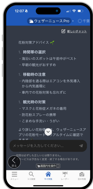
図 4: 花粉対策アドバイスを回答