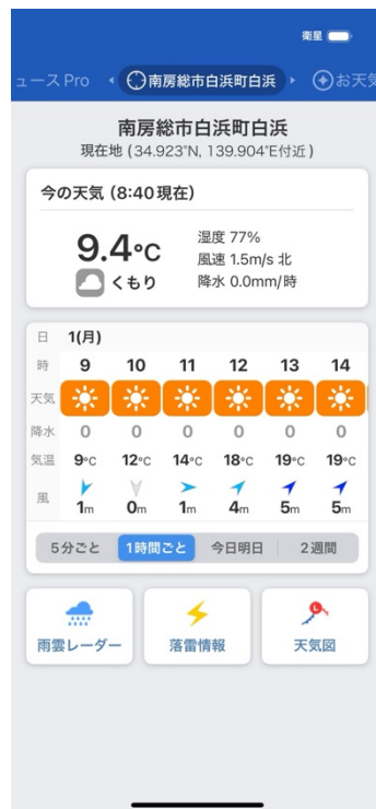
図 2. 現在地の天気