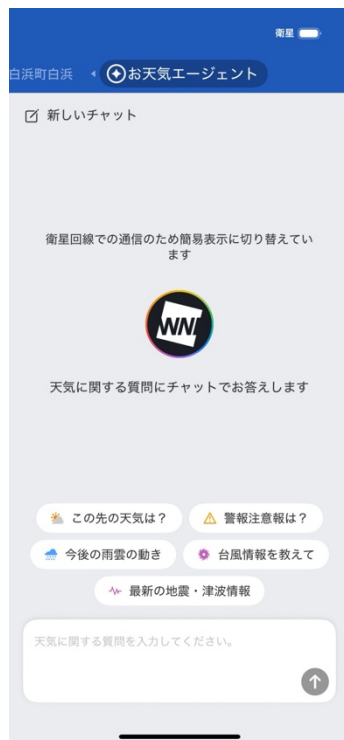
図 1. お天気エージェント