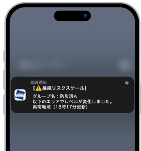
プッシュ通知画面

「ウェザーニュース for business」では、今回新たに開発した機能以外にも、自治体業務をサポートする多彩なコンテンツを搭載しています。例えば、30 時間先まで確認できる雨雲レーダーや落雷リスクモニタリングは屋外イベント、屋外作業の実施可否判断や事前の対策等にお使いいただけます。さらには大雨・強風が起こった際の振り返りや報告書作成に必要な観測情報・警報発表履歴のダウンロードが可能です。データに基づいた資料作成が迅速に行えるため、事後の報告書作成業務を効率化します。これらの機能で、平常時から防災業務、荒天後の検証・報告までをシームレスに支え、自治体業務の効率化と高度化を実現します。