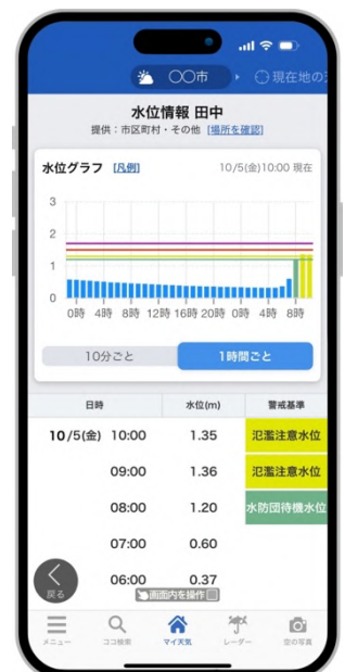
スマートフォンでも雨量や河川水位の状況が確認可能

「実況監視」は、雨量と河川水位をリアルタイム監視できるコンテンツです。重要施設や災害が起こりやすい場所にある雨量・水位観測地点を監視地点として設定できます。雨量については、10分雨量、60分雨量、連続雨量のそれぞれ監視することができ、体勢判断の基準に合わせて「注意」「警戒」の基準値を設定できます。表形式では、10分ごとに更新される実況の変化をもとに、危険度が高い地点順に自動で並び替えることや、基準値を超過している地点のみに絞り込んで表示することが可能で、多数の監視地点の中から今、最も警戒すべきエリアを瞬時に特定できます。グラフ形式では、各地点の雨量や水位の変化傾向を視覚的に捉え、グラフや地点名をクリックするだけで、地図画面にシームレスに遷移し、該当地点の位置や詳細な状況を確認することが可能です。