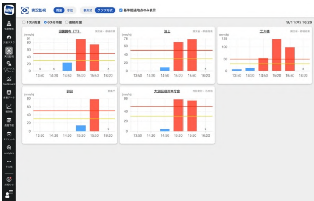
「実況監視」で雨量をグラフ形式で確認